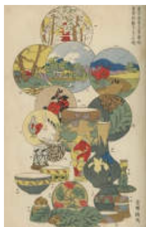
図 15 『大日本窯業協会雑誌』

ドイツ・ベルギーでの3年間の調査留学から、多くの参考品を持ち帰り、「新マジョリカ（ドイツふうマジョリカ）」こそが、新しい輸出用製品開発の手がかりになるという、平野耕輔教授の主張をカリキュラム展開していた東京高等工業学校のひとつの成果がここにあると考えられるでしょう。