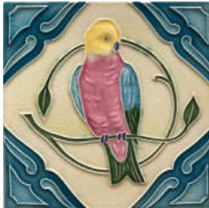
図 23 月星建陶社(曾根磁埴園製陶所)