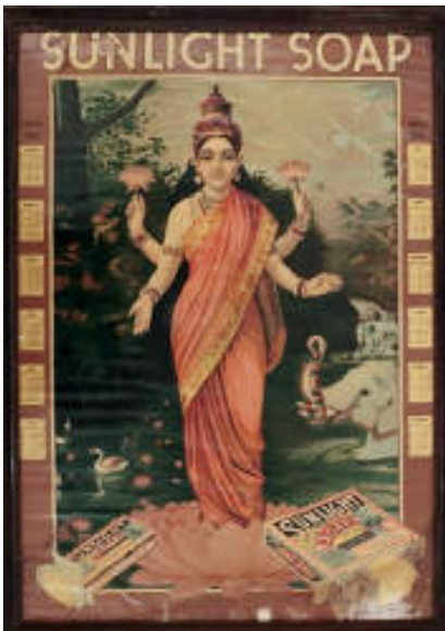
図 12 石鹼ポスター「ラクシュミー」