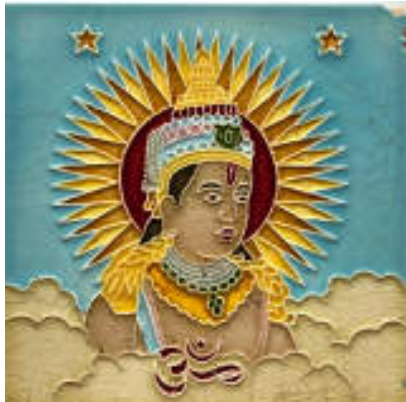
図 1 佐治タイル