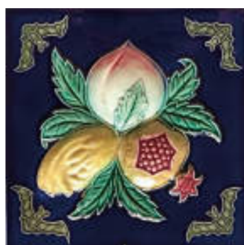
図 20 不二見焼、吉祥果物と蝙蝠