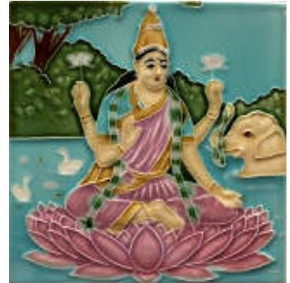
図 3 月星建陶社(曾根磁埴園製陶所)