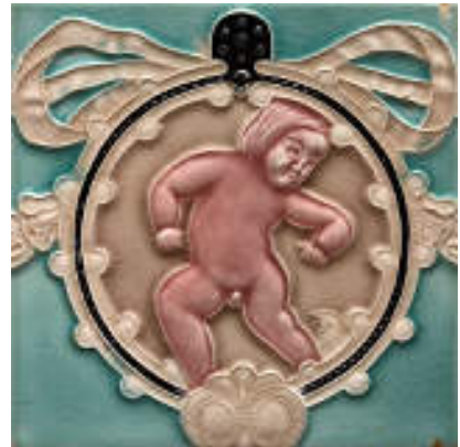
図 24 佐治タイル

一方、今現在のわたくしたちが和製マジョリカタイルに感じる魅力とは何でしょうか。戦前の焼き物ならではの釉薬の美しさがひとつ。もうひとつは、和製マジョリカタイルの、どこか奇妙な味わいにあると考えます。和製マジョリカタイルの作られた時代、大量生産技術と帝国主義によって物品はグローバルに流通し始めていましたが、人びとはまだ他国の文化に直に触れる機会がありませんでした。商売の必要に駆られて相手国の文化を手探りし、「こんな感じかな？」と焼き上げられた和製マジョリカタイルは、リアルなようでリアルでない、過剰なイメージの産物なのです。異文化への憧れというより、必死の企業努力。製造業としての気概や意地が生み出した時代の産物。そこにこそ、産業美術の面白さ、愛おしさがあると感じています。