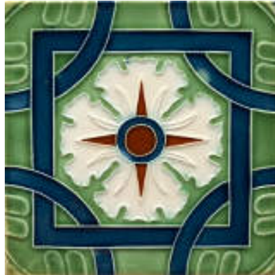
図 2 淡陶