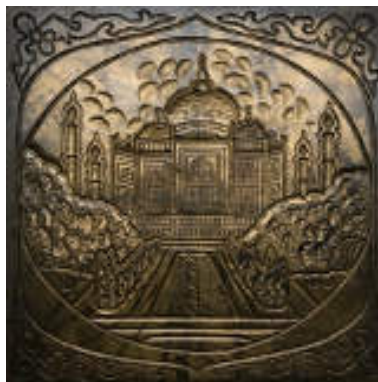
図6 広正製陶金型「タージ・マハル」