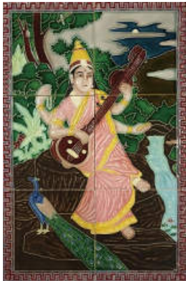
図 9 佐治タイル「サラスヴァティー」