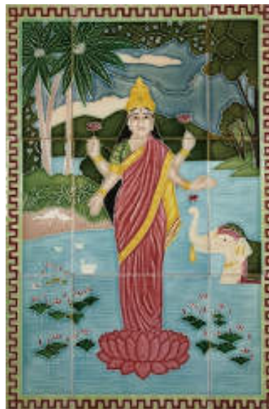
図 13 佐治タイル「ラクシュミー」