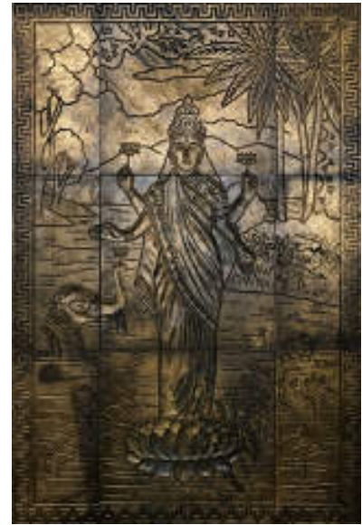
図 14 広正製陶金型「ラクシュミー」

和製マジョリカタイルの神々像と、元絵となったラージャー・ラヴィ・ヴァルマーのポスターを並べて見ていた時、最初は構図や、神々の容貌・仕草・持物・従える動物をしっかりと再現していることに目がいていたのですが、ある時、背景描法の違いに気がつき、はっとしました。ラージャー・ラヴィ・ヴァルマーの背景風景画は、レオナルド・ダ・ヴィンチやクロード・ロランが駆使した欧州伝統の空気遠近法で描かれています。前面に暗色を置き、中層には褐色や緑の樹々の葉、流れる水は奥にゆくほど淡い色彩にぼかし、最奥に青くけふる森(図 10)や山(図 12)を置くことによって、空間的広がり表現しています。それに対し、和製マジョリカタイルの背景は、白い凸線によって明確に色面分割し、大胆に図案化されたアール・ヌーボー様式で表現されていたのでした。金型によって凸線で絵柄を作り、区切られた面ごとに色鉛釉を置いてゆくマジョリカタイルの製法そのものを最大限に生かし、時代の流行を巧みに取り入れた製品が作り上げられています。産業製品には、この「新しさ」の感覚が欠かせません。