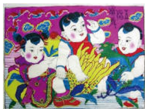
図 19 中国の木版年画

今回の展示とは少し離れますが、中国輸出向けの和製マジョリカタイルも少し見て見ましょう。最初に上海に和製マジョリカタイルを輸出したのは名古屋の不二見焼で、1920年（大正9年）のこと。これは日本のタイル製品輸出の先駆けでもありました。