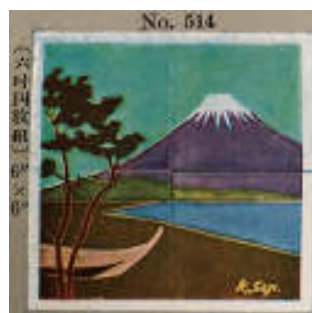
図 17 佐治タイルカタログより