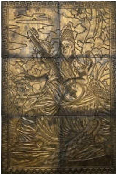
図 8 広正製陶金型「サラスヴァティー」