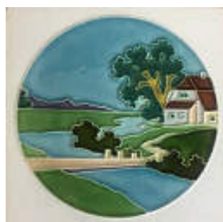
図 16 ドイツ製風景タイル