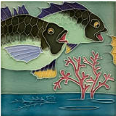
図 22 不二見焼

和製マジョリカタイルのメーカーは淡陶をのぞき、濃尾(岐阜・愛知)地域に集中していました。濃尾地域からのタイル輸出が盛んだった理由として、日本陶磁器意匠センター櫻井健二郎氏は、名古屋港・神戸港に商社が集まり、発注があれば各製陶所に効率的に発注・集荷して、一挙に船に積み込むシステムが出来上がっていたことを、馮赫陽氏は濃尾の製陶所は明治時代からすでに中国の人びとの嗜好に合わせてデザインを工夫し輸出量を増大させていたことを、指摘しています。こうした実績があったことが、愛知・岐阜のメーカーの中国・インド向けのタイル輸出増大の基礎になっていたと考えられます。欧州製よりも値段が安かったということはもちろんありますが、一方的に欧州デザインを押しつけるのではなく、先方の文化のもつ考え方や好みに応えつつ、世界的な流行デザインも加味して製品を開発してゆく、そこに和製マジョリカタイルの世界的普及の秘密がありました。