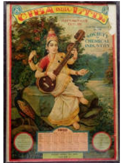
図 10 「サラスヴァティー」カレンダー

和製マジョリカタイルのヒンドゥー教の神々は、神々を描くときの伝統的な決まり事を正確に守って描かれています。インドの文化のことを何も知らない日本のタイルメーカーに、何故そんなことが可能だったのか？豊山氏は、そのデザイン・ソースについても解明しました。それは、インドの国民的画家、ラージャー・ラヴィ・ヴァルマーの絵画作品です。ラージャー・ラヴィ・ヴァルマーは、ヒンドゥー教の神々の姿や、神話の一場面を生き生きと描いた油彩画で人気を博し、裕福な人びとはその複製画を邸宅に飾っていました。ラージャー・ラヴィ・ヴァルマーはさらに、自ら油彩画を石版画にして大衆のもとにとどけるというプロジェクトを実行します。作品の複製画は石版のポスターやカレンダーともなり、庶民の家々や店舗にも飾られることになりました。彼の描法は新鮮なものでしたが、神々の容貌や、手にする持物、従えている動物などは、伝統的な描き方を守っており、それによって、ラージャー・ラヴィ・ヴァルマーの作品はやがて、インドの人びとの自国文化への誇りや民族独立の願いを表す象徴的な図像ともなっていくのだそうです。