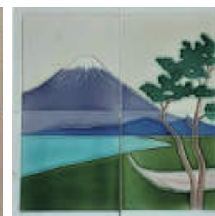
図 18 佐藤化粧煉瓦工場