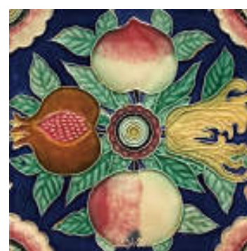
図 21 淡陶、吉祥果物

不二見焼は当初、イギリスのマジョリカタイルを真似た模様のな製品を中国に送っていましたが、上海の商社から「こうしたタイルは我々の興味を引かない。もっと違うデザインのタイルがほしい」と求められます。不二見焼は、上海の商社と漢文の手紙をやりとりしながら、中国向けのデザインに工夫を重ねます。社長の村瀬六郎は1929年（昭和4）、満州・華北への視察旅行に出発し、悪化しつつある日中関係のなかでも信頼関係を築き、中国の人びとが家に貼って福を願う「木版年画」を蒐集して帰国しました。中国の絵画や建築装飾は、描かれた物の故事、同音の言葉の連想遊びなど、幾重にも意味が張り巡らされたもので、単なる図柄ではありません。観る人に絵解きをさせない図像、メッセージを伝えない図像には価値が無い